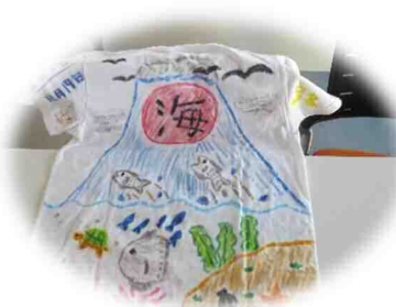
【sea シャツ作りの様子】