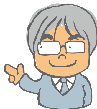
学長 杉本 龍紀